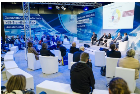
Für alle Messebesuchende kostenlos: von VdS-BrandSchutzTalk und mehr