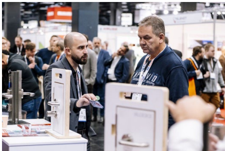
Die große internationale Fachmesse auf den VdS-BrandSchutzTagen