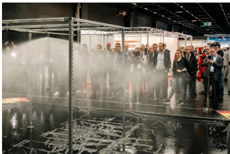
Typisch für die VdS-BrandSchutzTage sind zahlreiche Live-Demonstrationen