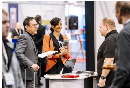
Auf den VdS-BrandSchutzTagen 2024 sind rund 170 Aussteller vertreten