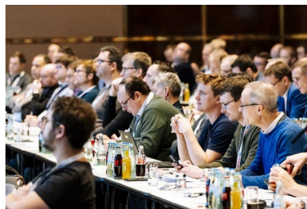
Insgesamt acht Fachtagungen finden parallel zur Fachmesse statt