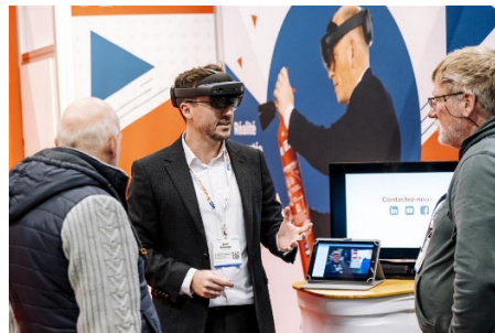
Die Besucher:innen der Messe informieren sich über Brancheninnovationen