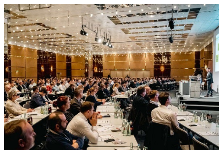
Insgesamt sieben Fachtagungen finden parallel zur Fachmesse statt