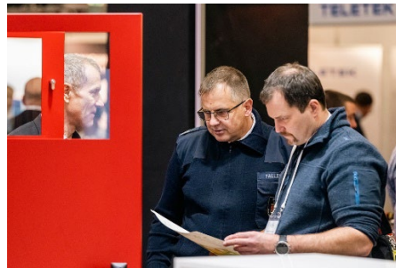
Die Besucher:innen der Messe informieren sich über Brancheninnovationen