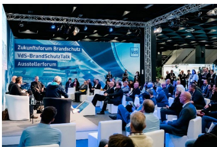
Für alle Messebesuchende kostenlos: der VdS-BrandSchutzTalk und mehr