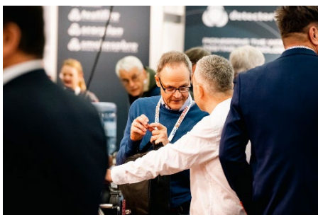
Die VdS- BrandSchutzTage bieten optimale Gelegenheiten zum Netzwerken