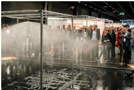
Typisch für die VdS-BrandSchutzTage sind zahlreiche Live-Demonstrationen