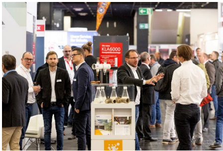
Die große internationale Fachmesse auf den VdS-BrandSchutzTagen