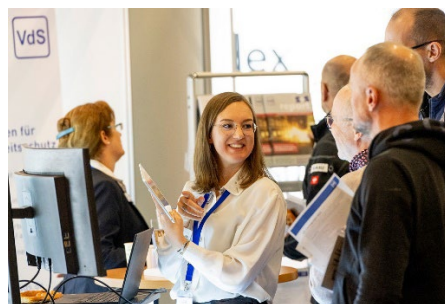
An beiden Tagen führen Messerundgänge zu interessanten Exponaten